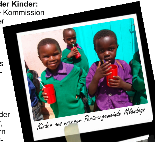
Kinder aus unserer Partnergemeinde Mlandege

20 € pro Jahr. Die Kosten beinhalten eine Mahlzeit für jedes Kind pro Tag sowie Kindergartenkleidung und Personalkosten