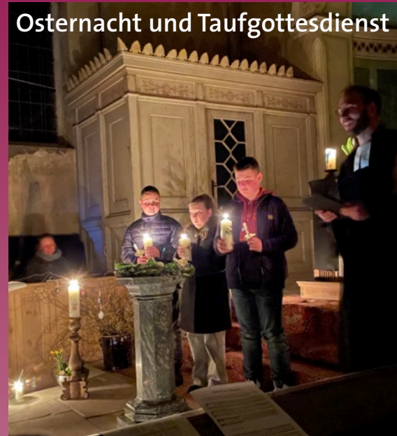
Osternacht und Taufgottesdienst