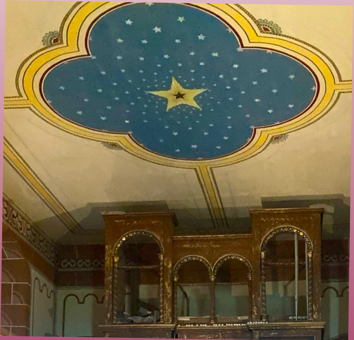
Sternenhimmel der St. Michael Kirche Bösenburg

Gemeindebrief des Evangelischen Pfarrbereichs Gerbstedt