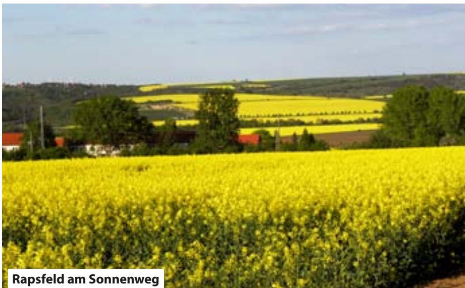
Rapsfeld am Sonnenweg

Himmelfahrt 09. Mai - 14.00 Uhr Schloss Mansfeld