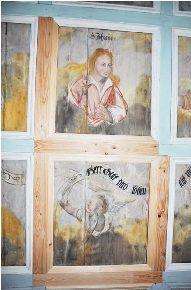
Detailaufnahme zweier Kassettenfelder, während der Restaurierung, mit erneuerter Kassettenrahmung; Januar 2020.