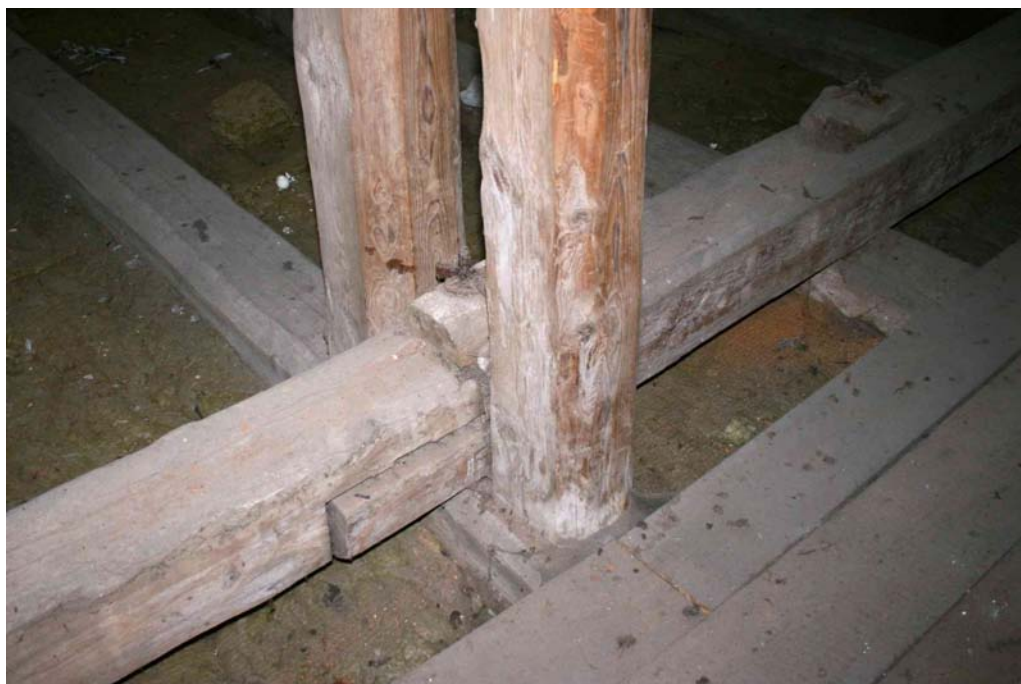
Knotenpunkt von Deckenbalken, Überzug und Hängesäule, diese statisch tragenden Knotenpunkte wurden einzeln auf Kraftschlüssigkeit geprüft und instand gesetzt; Juni 2020.