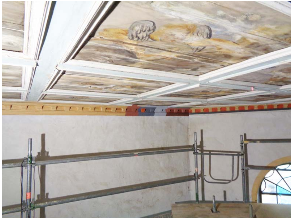
Chor, Nordostecke, Kassettendecke mit Beginn der Restaurierungsarbeiten, Probeflächen zur Farbfassung des Randfrieses; Dezember 2019.