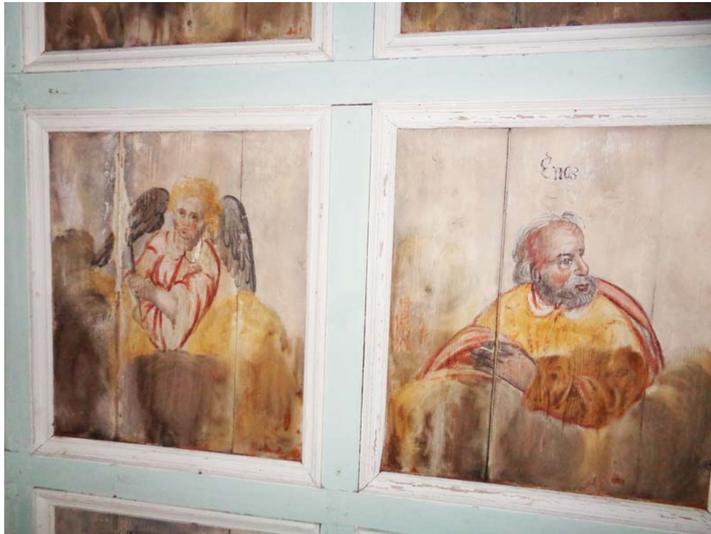
Detail zweier Kassettenfelder, vor Restaurierungsbeginn; November 2019.