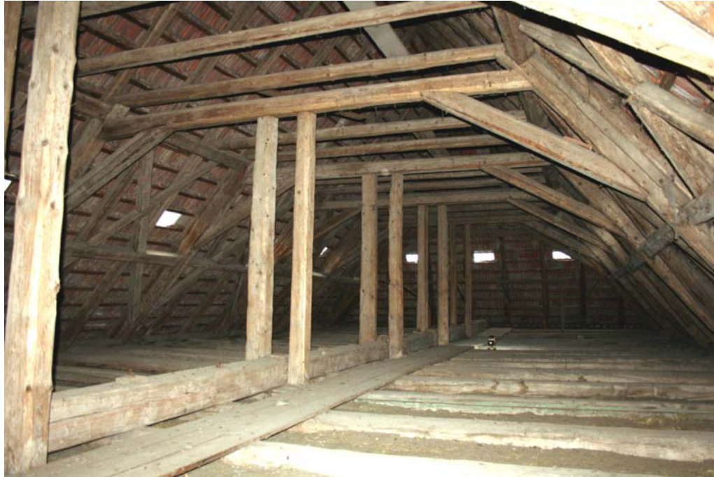
Das Dachtragwerk des Kirchenschiffes mit statisch-tragender Horizontaldecke, welche die bemalte Kassettendecke aus dem Ende des 17. Jh. aufnimmt, nach Südwesten; Juni 2020.