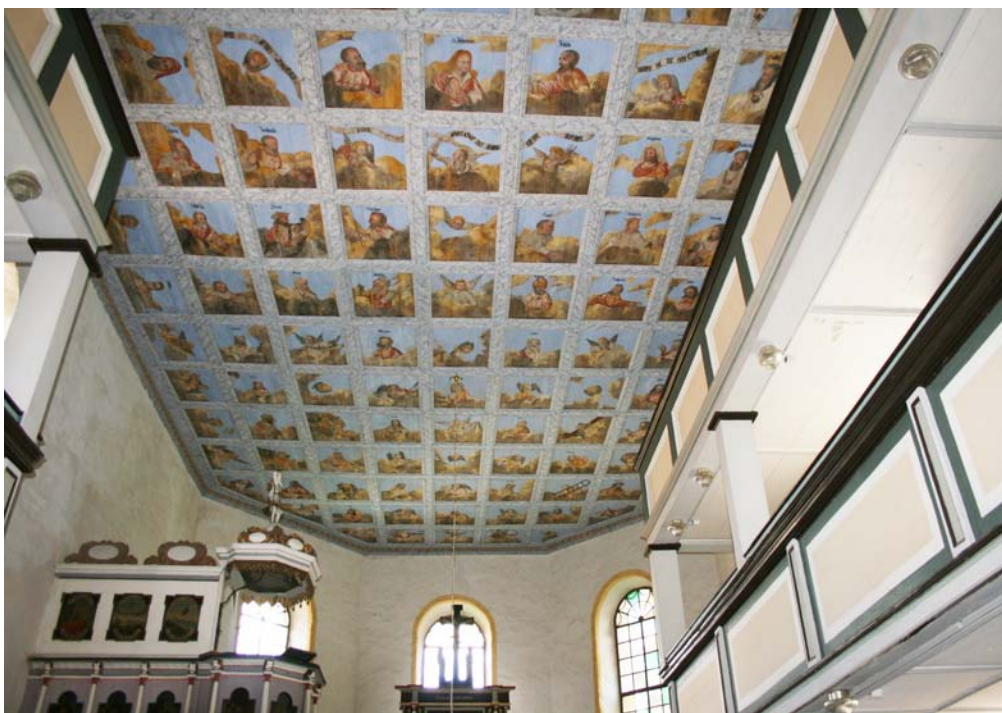
Kassettendecke im Chor/Ostteil des Kirchenschiffes, nach Osten, mit Abschluss der Restaurierung; Juni 2020.