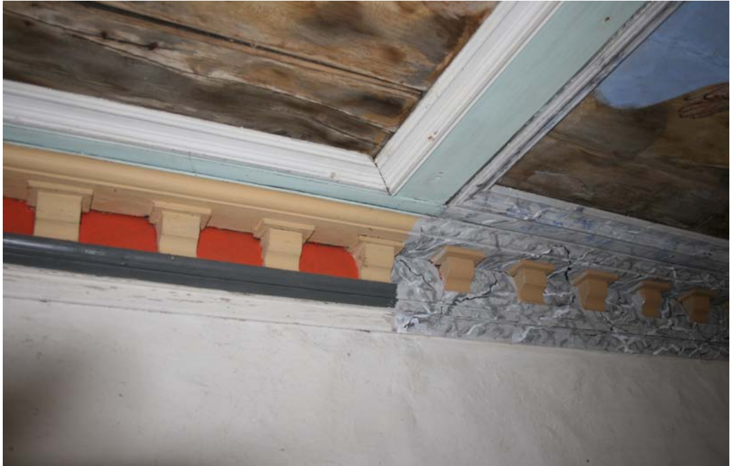
Detail der Probefarbfassungen zur Ausführung des Randfrieses; Juni 2020.