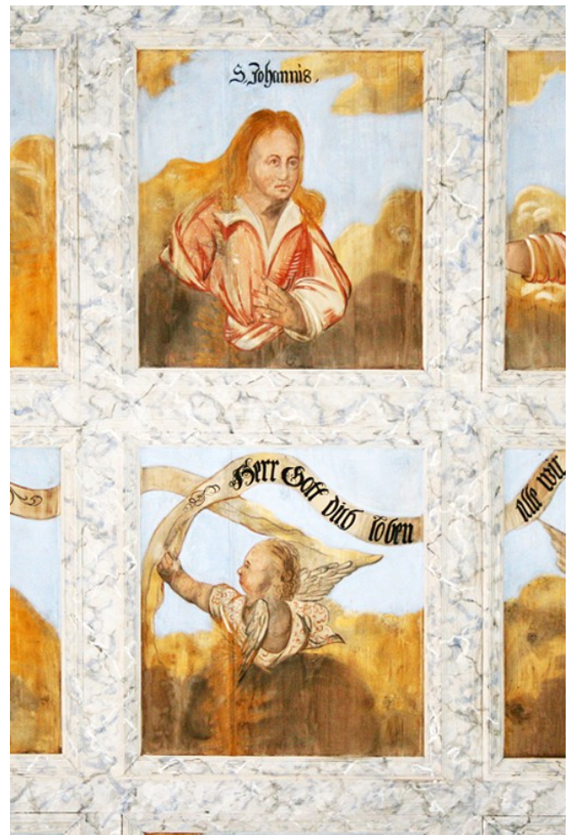
Detailaufnahme zweier Kassettenfelder mit Fertigstellung der Restaurierung; Juni 2020.