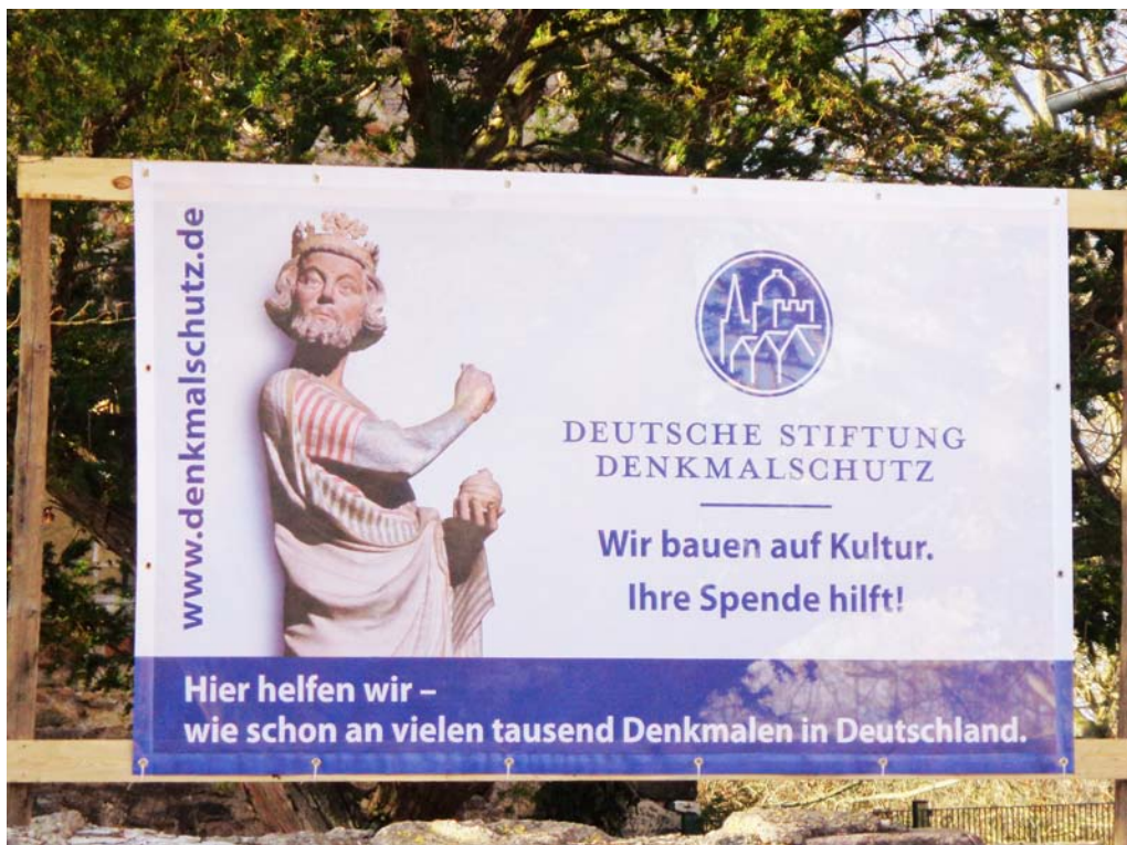
Das Banner der DEUTSCHEN STIFTUNG DENKMALSCHUTZ; Dezember 2019.