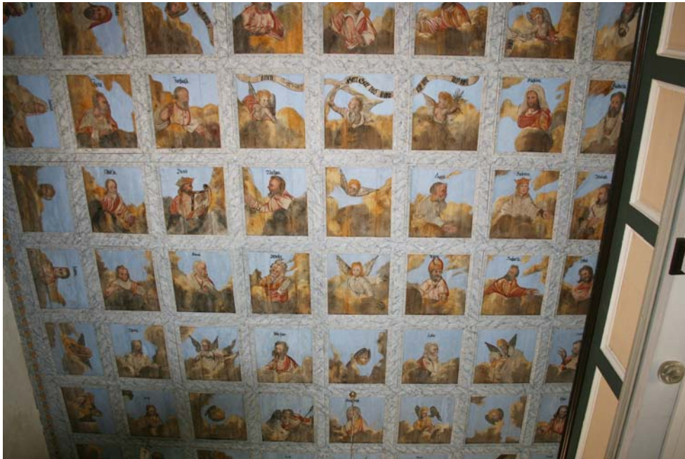
Restaurierte Kassettendecke etwa im Mittelteil des Kirchenschiffes, mit Abschluss der Restaurierungsarbeiten; Juni 2020.