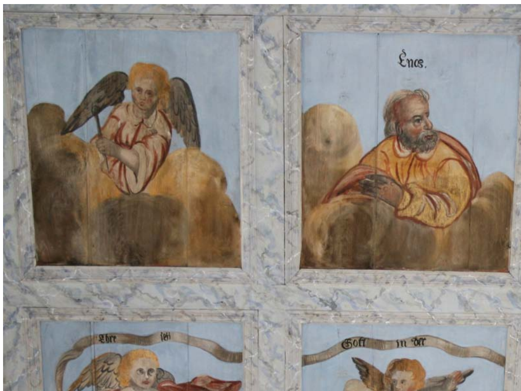
Mit Abschluss der Restaurierung; Juni 2020.