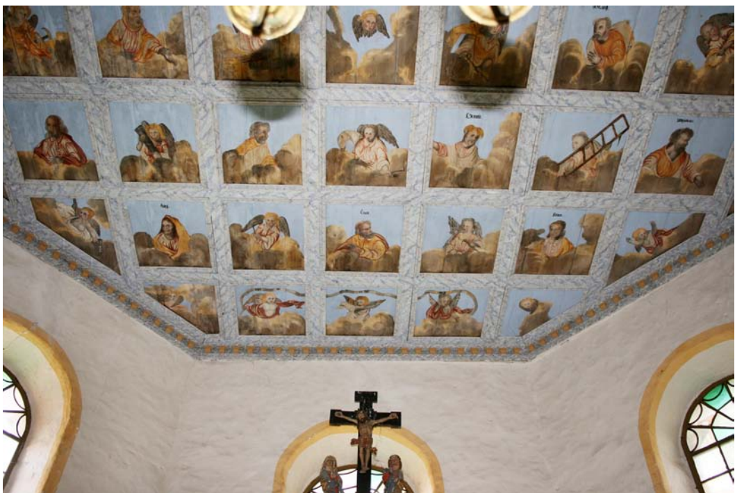
Kassettendecke im polygonalen Ostabschluss des Chores, mit Fertigstellung und Abschluss der Restaurierung; Juni 2020.