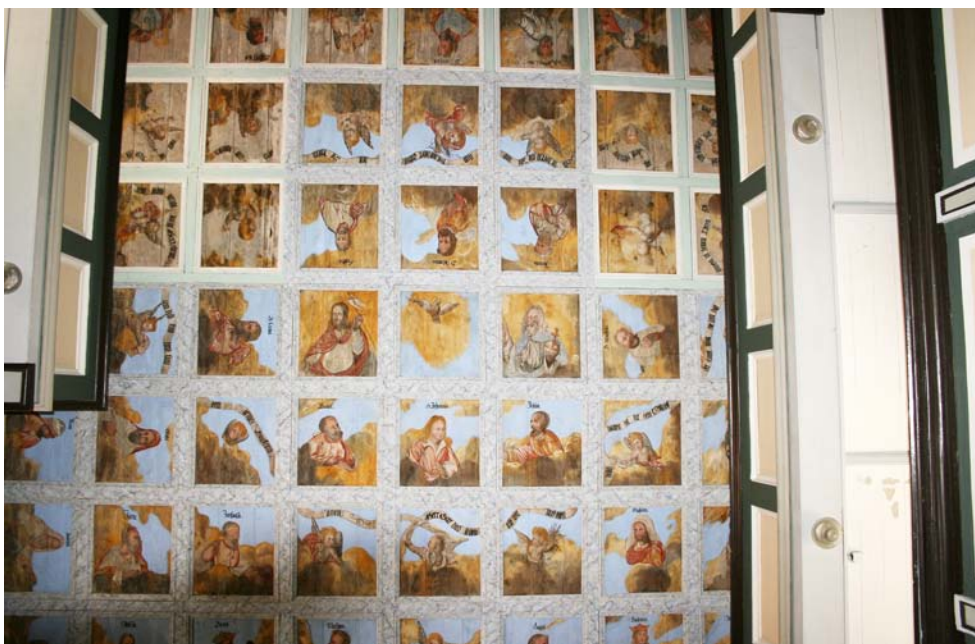
Restaurierte Kassettendecke etwa in Raummitte des Kirchenschiffes, unrestaurierte Kassettendecke Richtung Westen zur Orgel hin; Juni 2020.