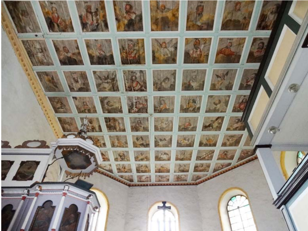
Kassettendecke im Chor/Ostteil des Kirchenschiffes, nach Osten, vor Restaurierungsbeginn; Juni 2017.